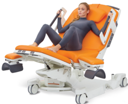
Halvliggande med fötterna på fotsektionen