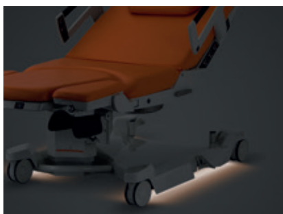
Belysning under sängen