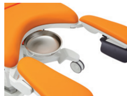
Skjutbar 4,5 l skål av rostfritt stål