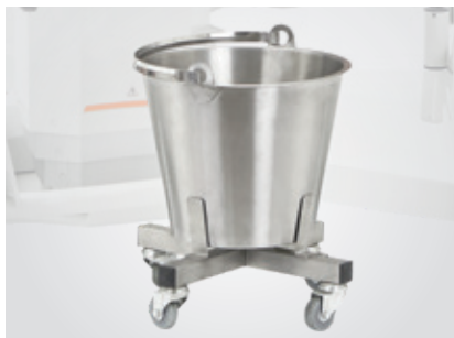
Hink av rostfritt stål med hjul