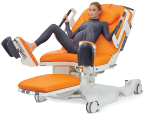
Halvliggande med fötterna mot benstöden