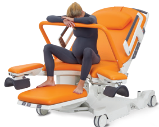
Stödstång för nedhukat läge